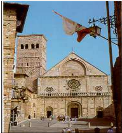
LA CATTEDRALE DI S.RUFINO